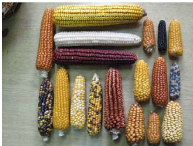
Slika 2. Klip hibridnog kukuruza (gore u sredini) i klipovi nekoliko lokalnih populacija kukuruza

Prvi hibridi kukuruza na prostorima bivše Jugoslavije uvode se u proizvodnju 1953. godine, od kada lokalne slobodnoprašujuće sorte postepeno gube na značaju. Najšira varijabilnost unutar vrste nastaje u prirodnim uslovima kao rezultat kontinuiranog procesa variranja, ukrštanja i selekcije u veoma dugom vremenskom periodu i na velikom prostoru. Stoga lokalne slobodnoprašujuće populacije kukuruza predstavljaju potencijalno veliku rezervu genetičke varijabilnosti koja se može iskoristiti za stvaranje sintetičkih populacija široke genetičke osnove, koje bi bile stalni izvor za dobijanje komercijalnih samooplodnih linija. Uviđajući ovu činjenicu, kao i činjenicu da se prelaskom na hibridne sorte enormno smanjuje genetička varijabilnost gajenih useva kukuruza, naši istraživači su preduzeli aktivnosti u sakupljanju i čuvanju lokalnih populacija kukuruza, gotovo istovremeno sa uvođenjem hibrida u proizvodnu praksu. Prvo sistematsko sakupljanje lokalnih populacija kukuruza na teritoriji bivše Jugoslavije bilo je u periodu od 1961. do 1965. godine. Sakupljeno je oko 1.000 sorti iz Vojvodine, Slavonije i Pomoravlja. Institucije koje su učestvovala u ekspediciji prikupljanja uzoraka bile su Institut za kukuruz „Zemun Polje”, USDA i Jugoslovensko savezno udruženje istraživača. Sedamdesetih